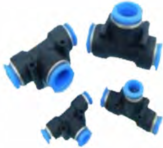
Union Conectora para Poliamida (TEE - Tubo - Tubo) Modelo PE