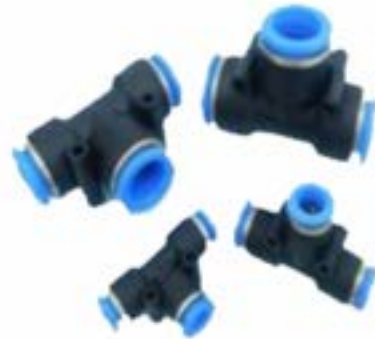
Union Conectora para Poliamida (TEE - Tubo - Tubo) Modelo PE