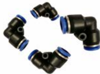
Union Conectora para Poliamida (Angulo 90°) Modelo PV