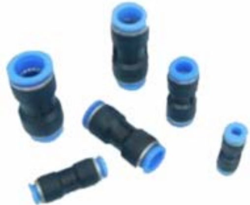
Union Conectora para Poliamida (Tubo - Tubo) Modelo PU