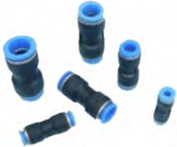
Union Conectora para Poliamida (Tubo - Tubo) Modelo PU