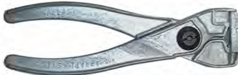
Para abrazaderas plásticas VS