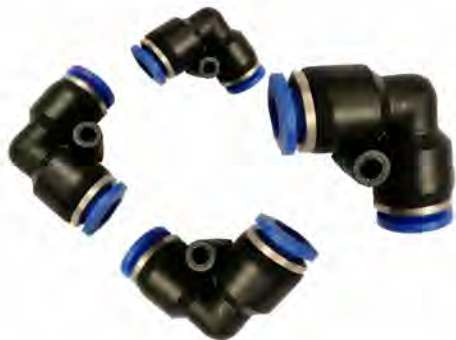
Union Conectora para Poliamida (Tubo - 90°) Modelo Pv